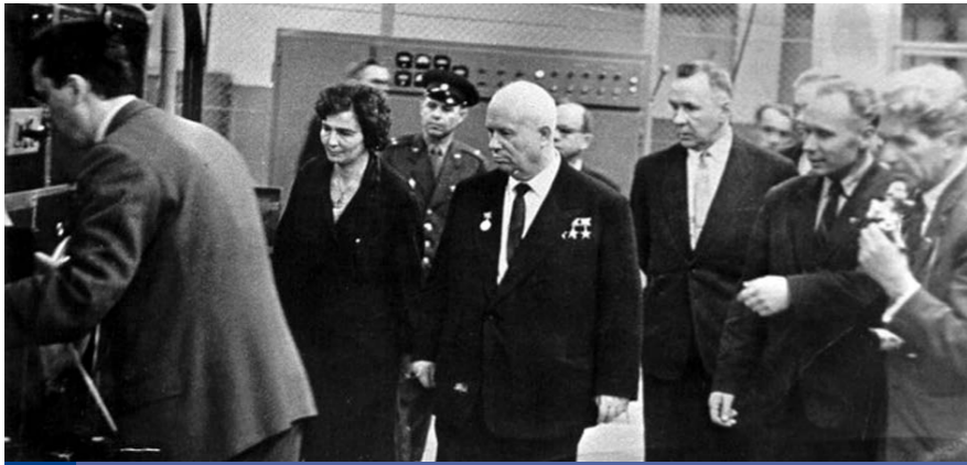
Из истории комбината. Генеральный секретарь Никита Сергеевич Хрущёв и Алексей Николаевич Косыгин знакомятся с производством.