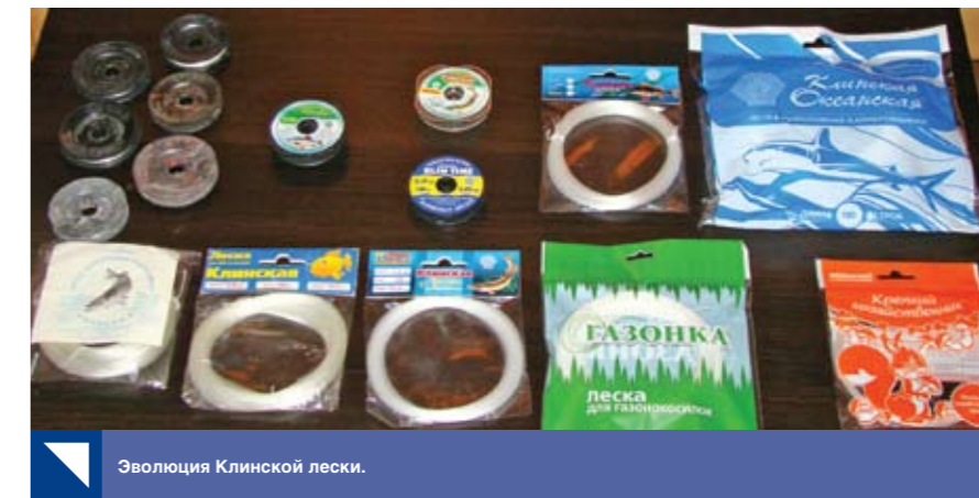
Эволюция Клинской лески.

А.М.: На сегодняшний день уже все размотчики, специализирующиеся на розничной расфасовке, переживают кризис. Даже те, кто свел свои накладные расходы к минимуму и разматывает самостоятельно в не отапливаемом гараже, не может выдержать конкуренцию с фальсифицированной продукцией из КНР, которая распространяется через уличные и вещевые рынки во многих регионах. После закрытия Черкизовского рынка в Москве многим оптовикам пришлось объясняться с постоянными покупателями по поводу торговли подделками. Понимание цены китайской продукции наступает, если проверить диаметр и длину лески в мотке. Результат поражает — недостача диаметра